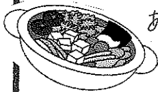
あつあつ鍋 野菜いっしょ 食べましょ

新しい年を迎えるにあたって、めんどうでも、やっておか なくちゃと思う事(自分な)にですが、もスッキリさせて 年を越す事にしています。まだ暖かいうちに、